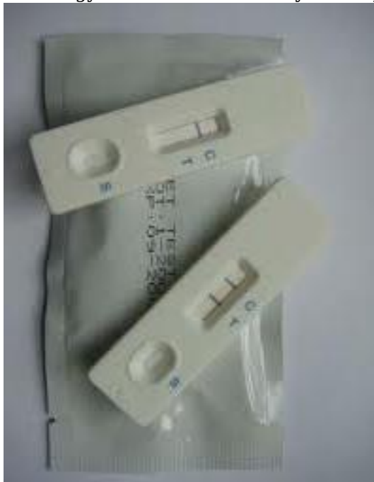
A mintavétel (vizelet);